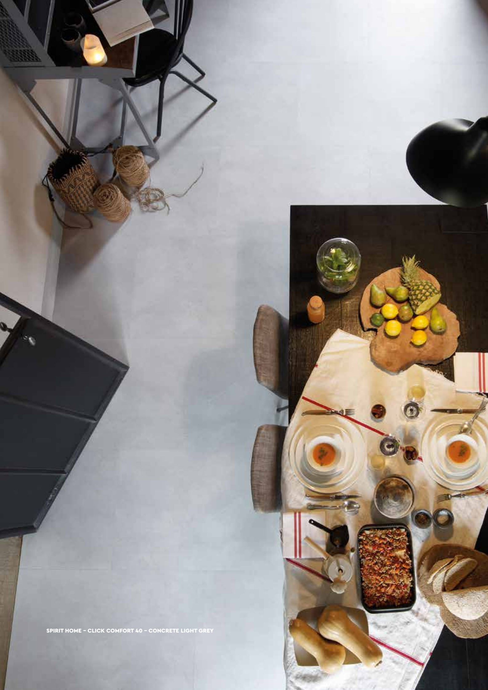
SPIRIT HOME - CLICK COMFORT 40 - CONCRETE LIGHT GREY