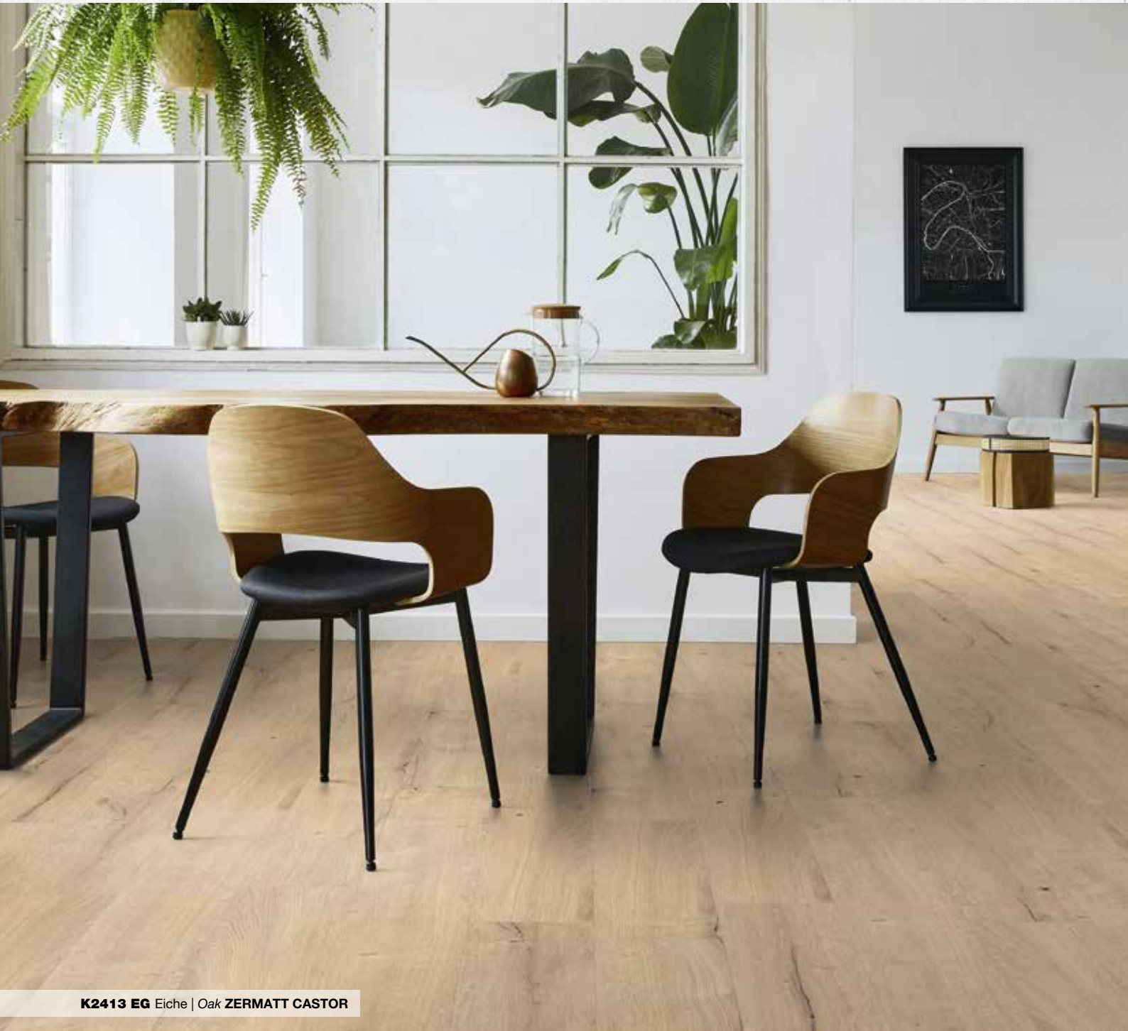
K2413 EG Eiche | Oak ZERMATT CASTOR