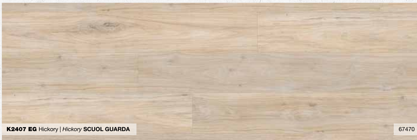
K2407 EG Hickory | Hickory SCUOL GUARDA