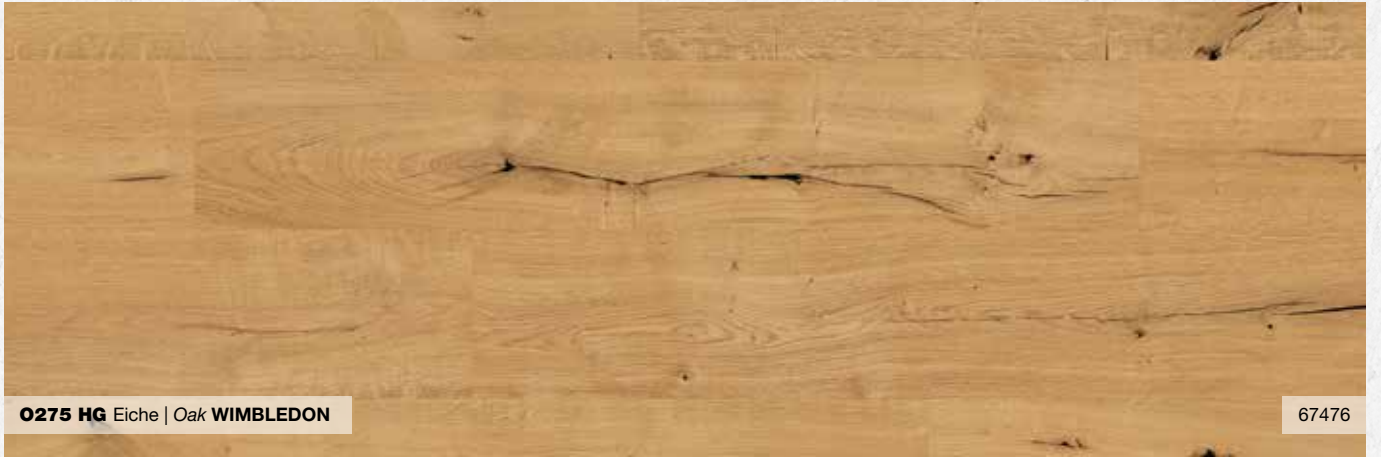
O275 HG Eiche | Oak WIMBLEDON