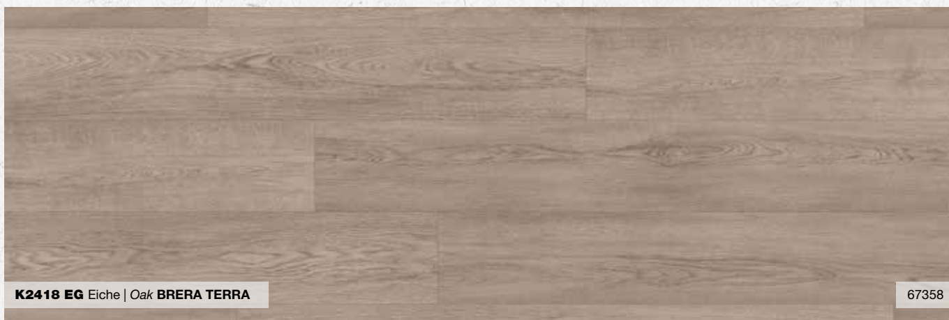
K2418 EG Eiche | Oak BRERA TERRA