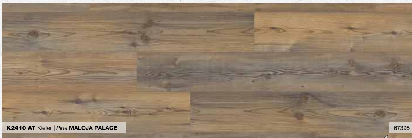
K2410 AT Kiefer | Pine MALOJA PALACE