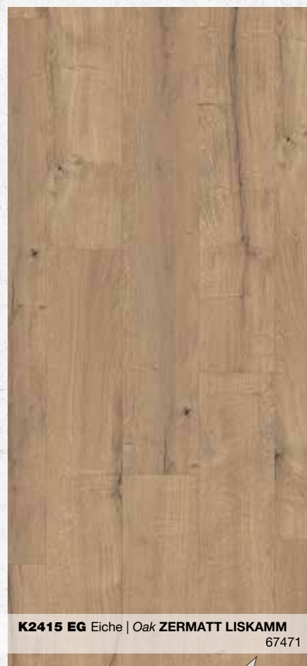
K2415 EG Eiche | Oak ZERMATT LISKAMM 67471