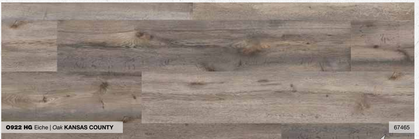
O922 HG Eiche | Oak KANSAS COUNTY