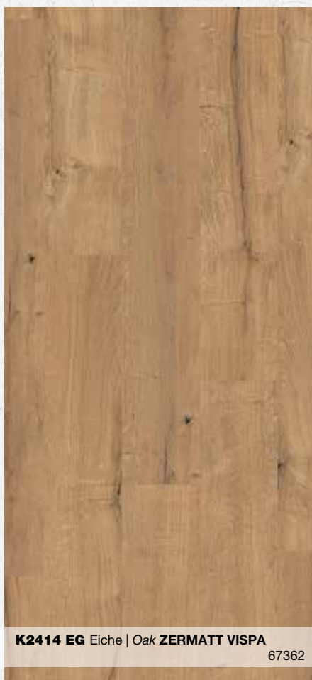
K2414 EG Eiche | Oak ZERMATT VISPA 67362