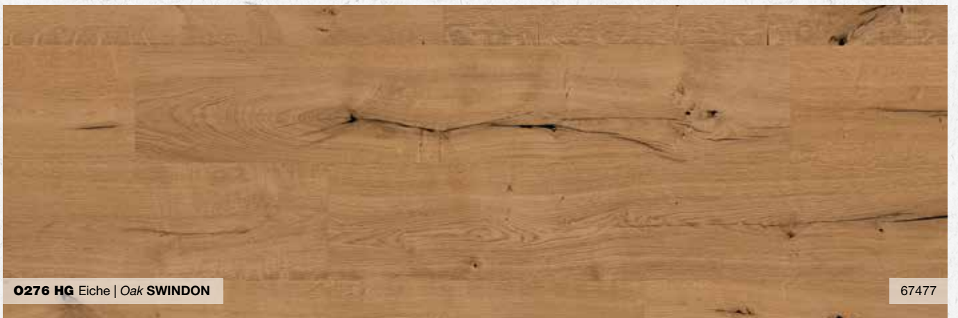
O276 HG Eiche | Oak SWINDON