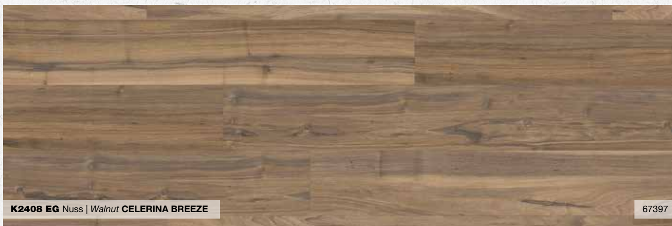
K2408 EG Nuss | Walnut CELERINA BREEZE