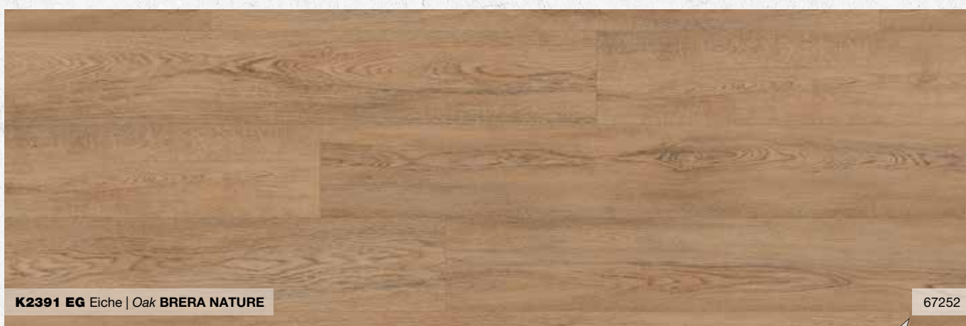
K2391 EG Eiche | Oak BRERA NATURE