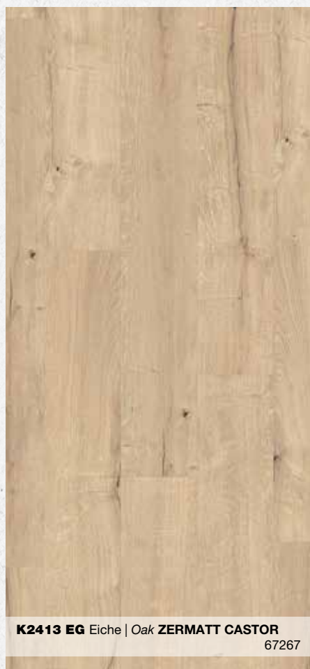
K2413 EG Eiche | Oak ZERMATT CASTOR 67267