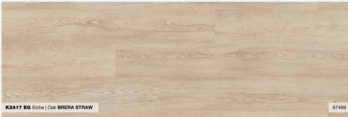
K2417 EG Eiche | Oak BRERA STRAW