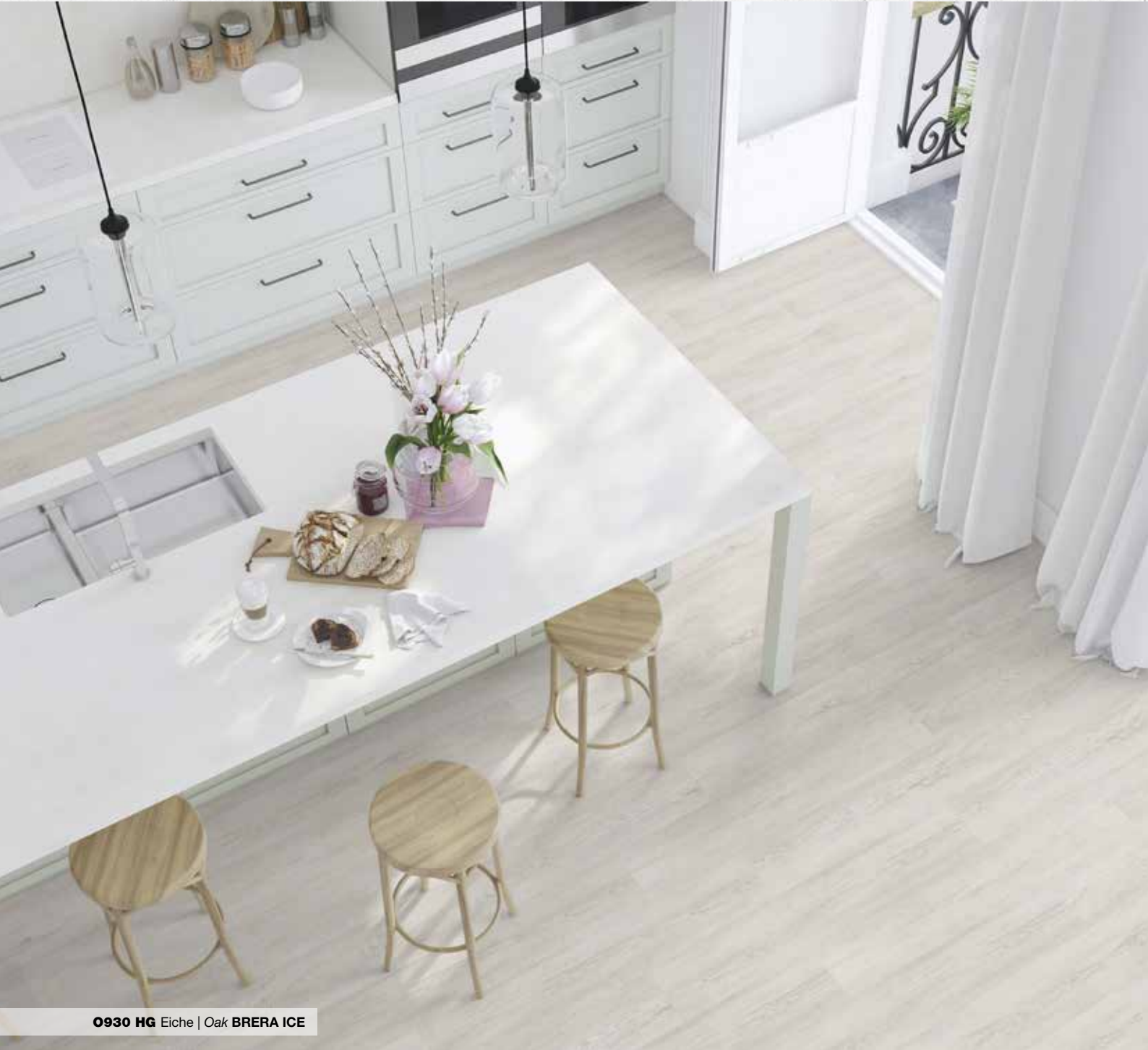
0930 HG Eiche | Oak BRERA ICE