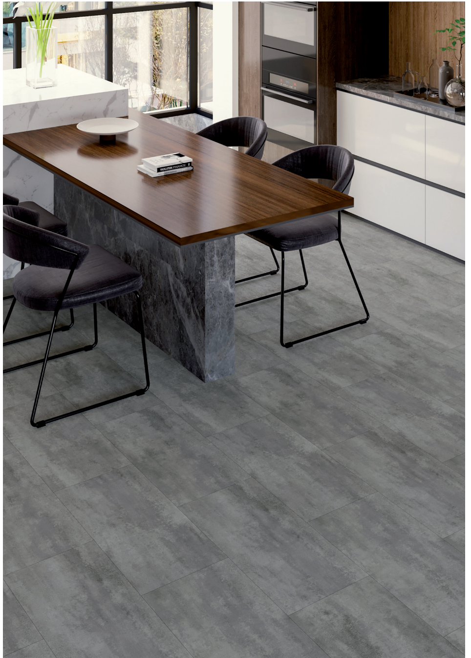
Palma # MOA01204-03