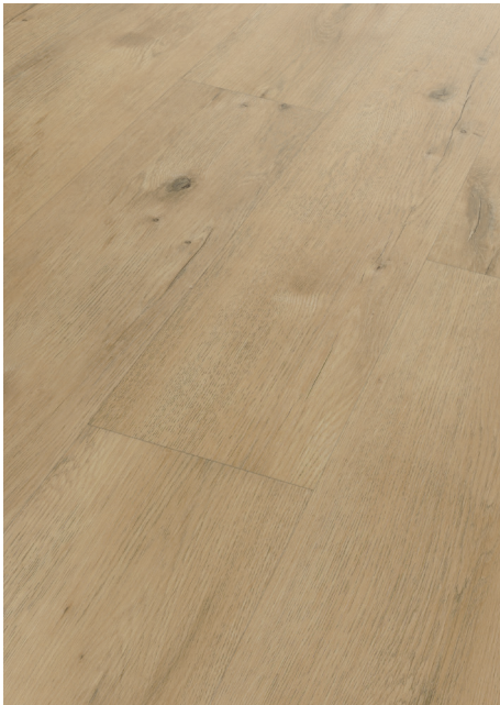
Eiche Hell # MV89020-03