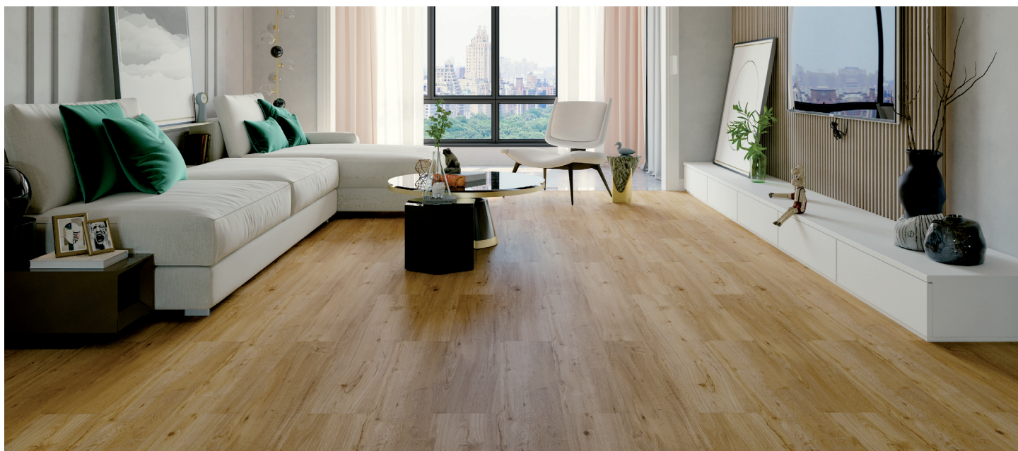
Eiche Classic # MX80842-3