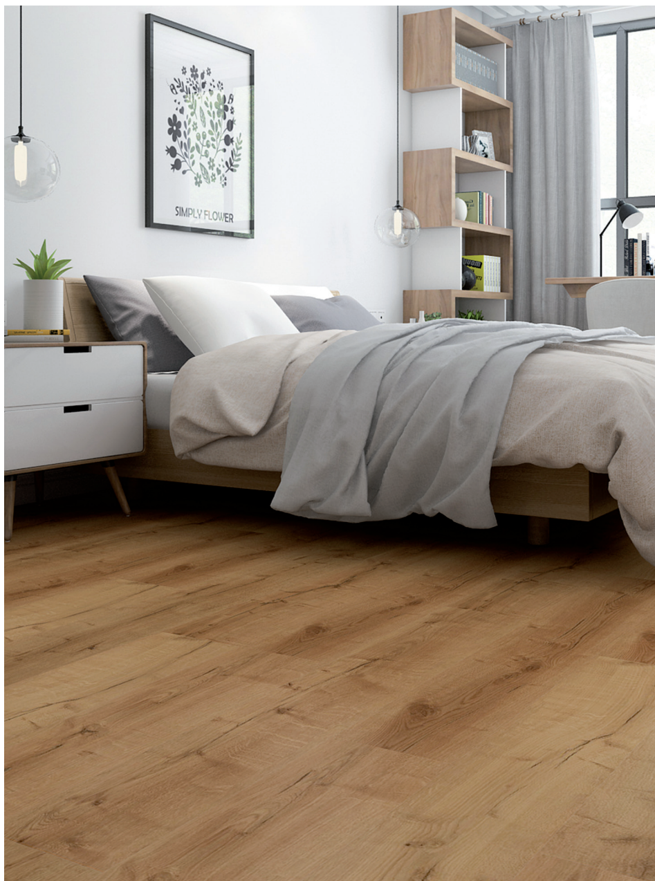
Eiche Natur # M82046-1