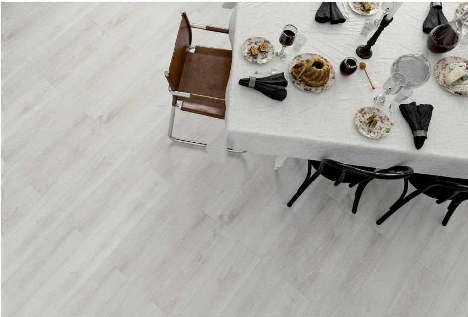
Weisseiche # MO8625L-07