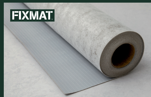
Fixmat # 106102985