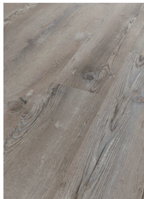
Graukiefer # MO287L-05