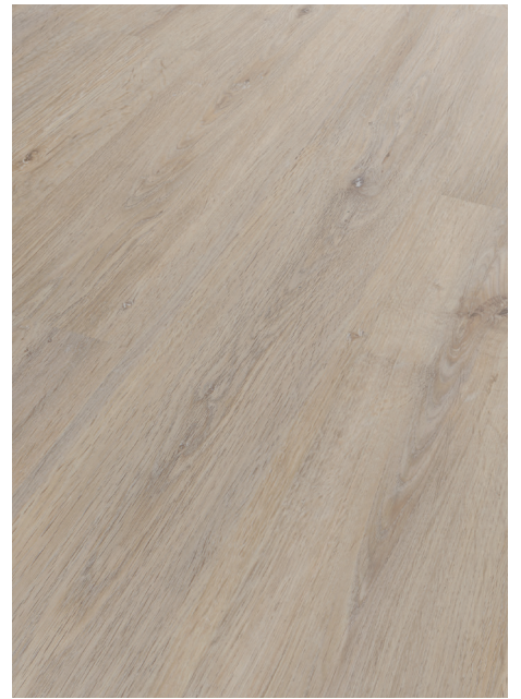
Eiche Cream # MJ6087-01