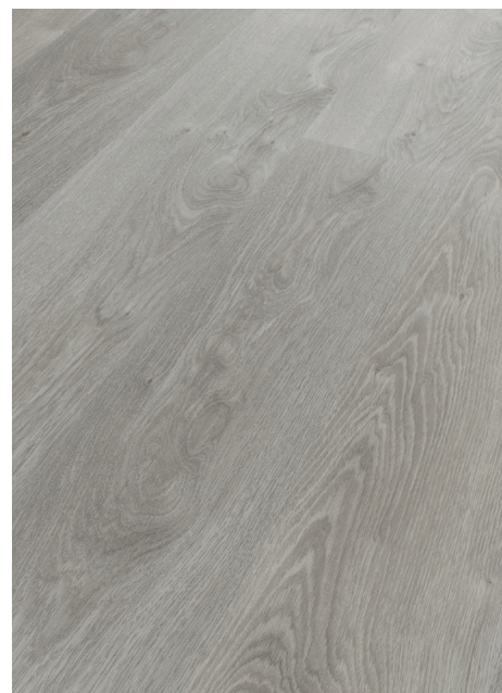
Graueiche # MB01117-08