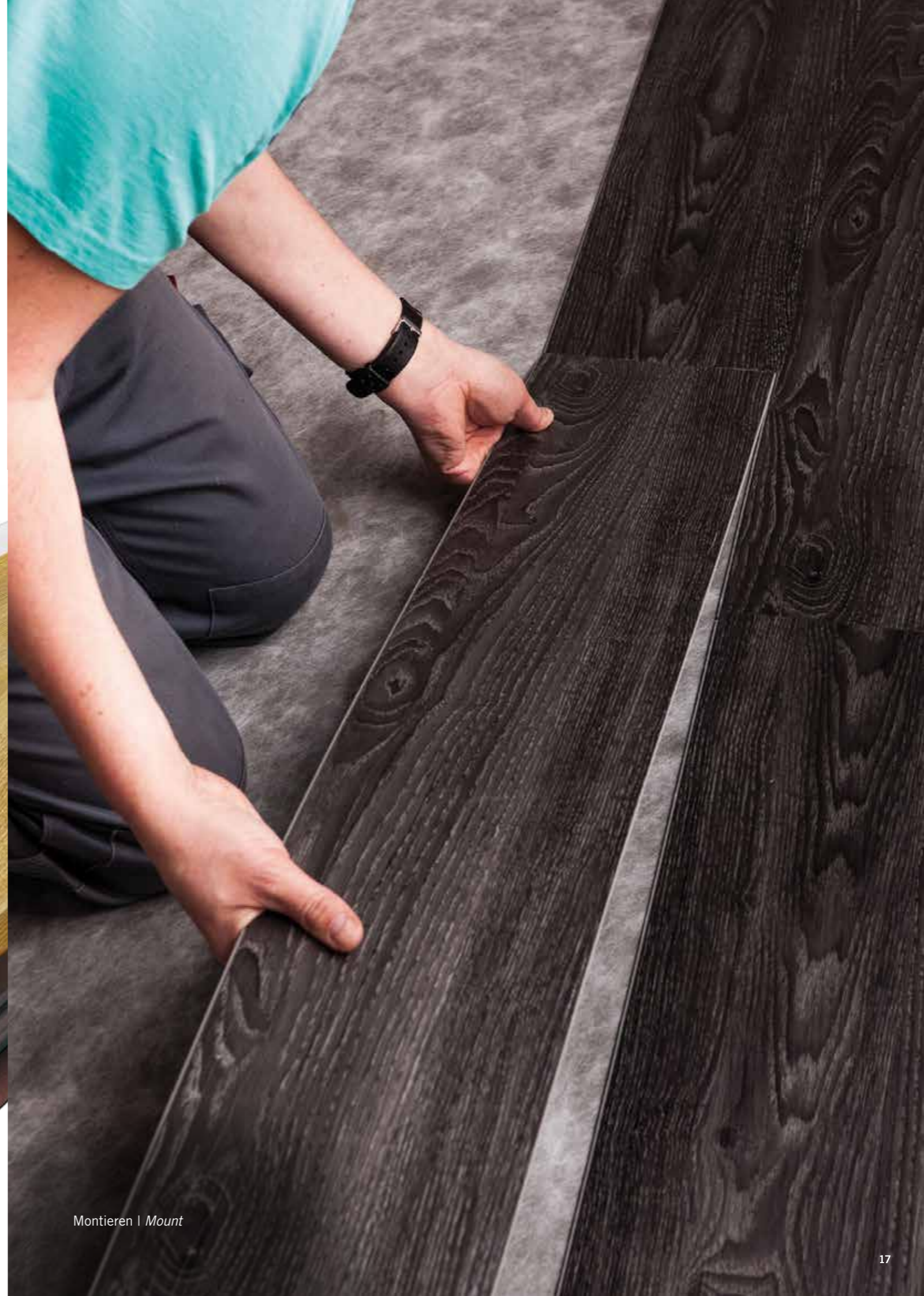
Montieren | Mount