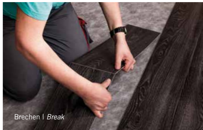
Brechen | Break